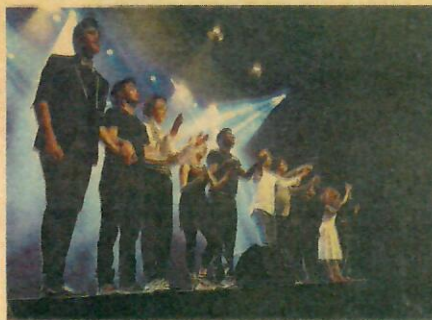
FIMAG El Festival Internacional de Màgia de Torroella de Montgrí encara su sexta edición postulándose como evento de referencia en el mundo de la magia.

Sin abandonar Torroella de Montgrí, pero con un carácter más familiar, el Festival Internacional de Màgia (Fimag) afronta el próximo verano su sexta edición. Fimag ha acogido más de cien espectáculos de magia al año, y ha atraído