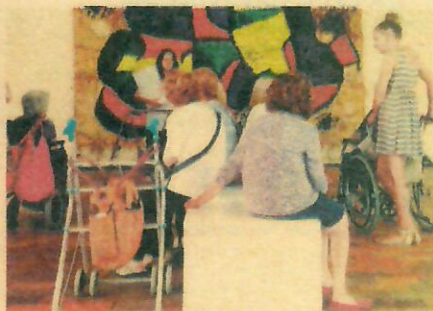
APROPA CULTURA Bajo el lema 'todo el mundo tiene derecho a la cultura', la plataforma pretende acercar esta realidad a personas con dificultades o colectivos en riesgo.

hacia Torroella a alrededor de 20.000 visitantes de media en cada edición, con un sensible crecimiento año a año. Además, este festival cuenta con más de 200 voluntarios para su desarrollo, y sus cos-