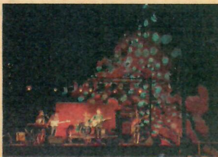
FRINGE FESTIVAL Los impulsores del proyecto idearon un festival que buscara la variedad y la excelencia, en un entorno cercano y de convivencia entre músicos y público.